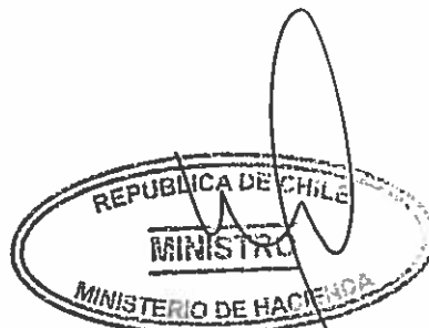
RODRIGO VALDÉS PULIDO MINISTRO DE HACIENDA